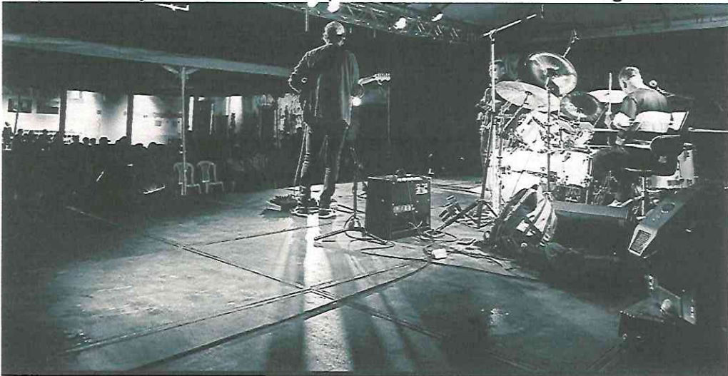
Introducción de canción Cimiento Guitarra y batería