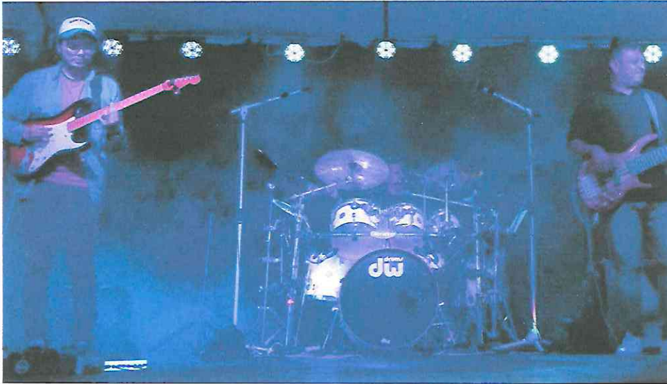
Perspectiva de la canción cimientó